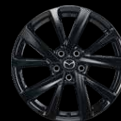
18" Lichtmetalen velgen Black Glossy, design 72A