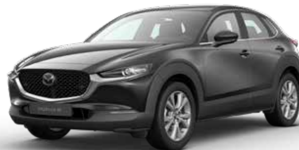
JET BLACK MICA € 800