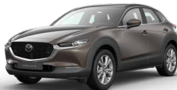
TITANIUM FLASH MICA € 800