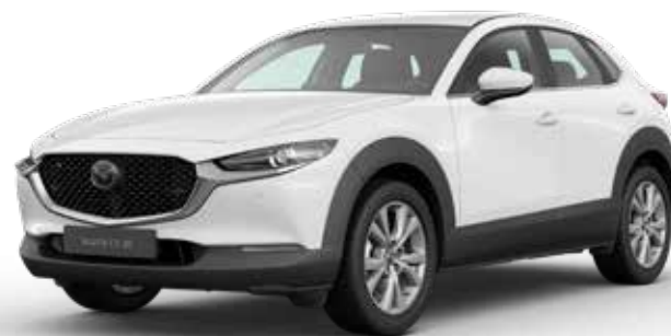
ARCTIC WHITE SOLID

Je hebt keuze uit negen kleuren. Arctic White Solid vormt de basis. Machine Gray Metallic en Soul Red Crystal Metallic zijn het meest exclusief. Een speciale laktechniek met nog kleinere en heldere aluminiumdeeltjes zorgt voor een ongekend diepe, heldere kleur.