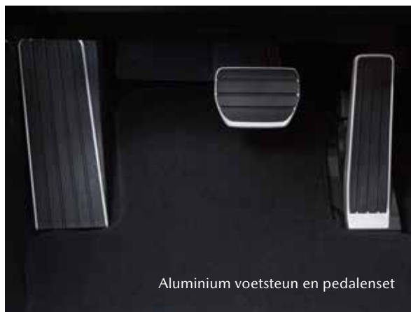
Aluminium voetsteun en pedalenet