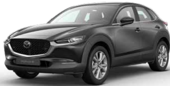
JET BLACK MICA € 800