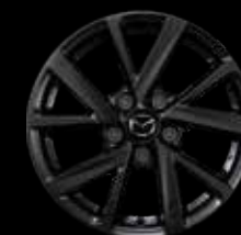
16" Lichtmetalen velgen Palladium, design 71A