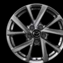
16" Lichtmetalen velgen Silver, design 71

Setprijzen incl. BTW, incl. TPMS-sensoren, excl. banden. Bandenprijzen kun je opvragen bij je Mazda dealer.