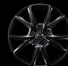
17" Lichtmetalen velgen Black Glossy, design 73A