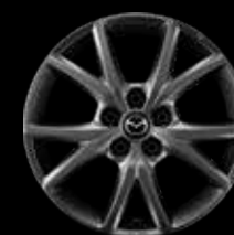
17" Lichtmetalen velgen Hyper Gun, design 73