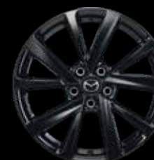
18" Lichtmetalen velgen Black Glossy, design 72A