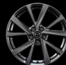
18" Lichtmetalen velgen Chrome Shadow, design 72